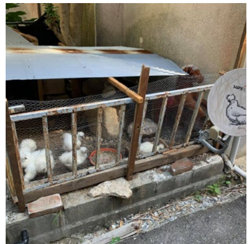
LOST BIRD 坂本ひろきさん