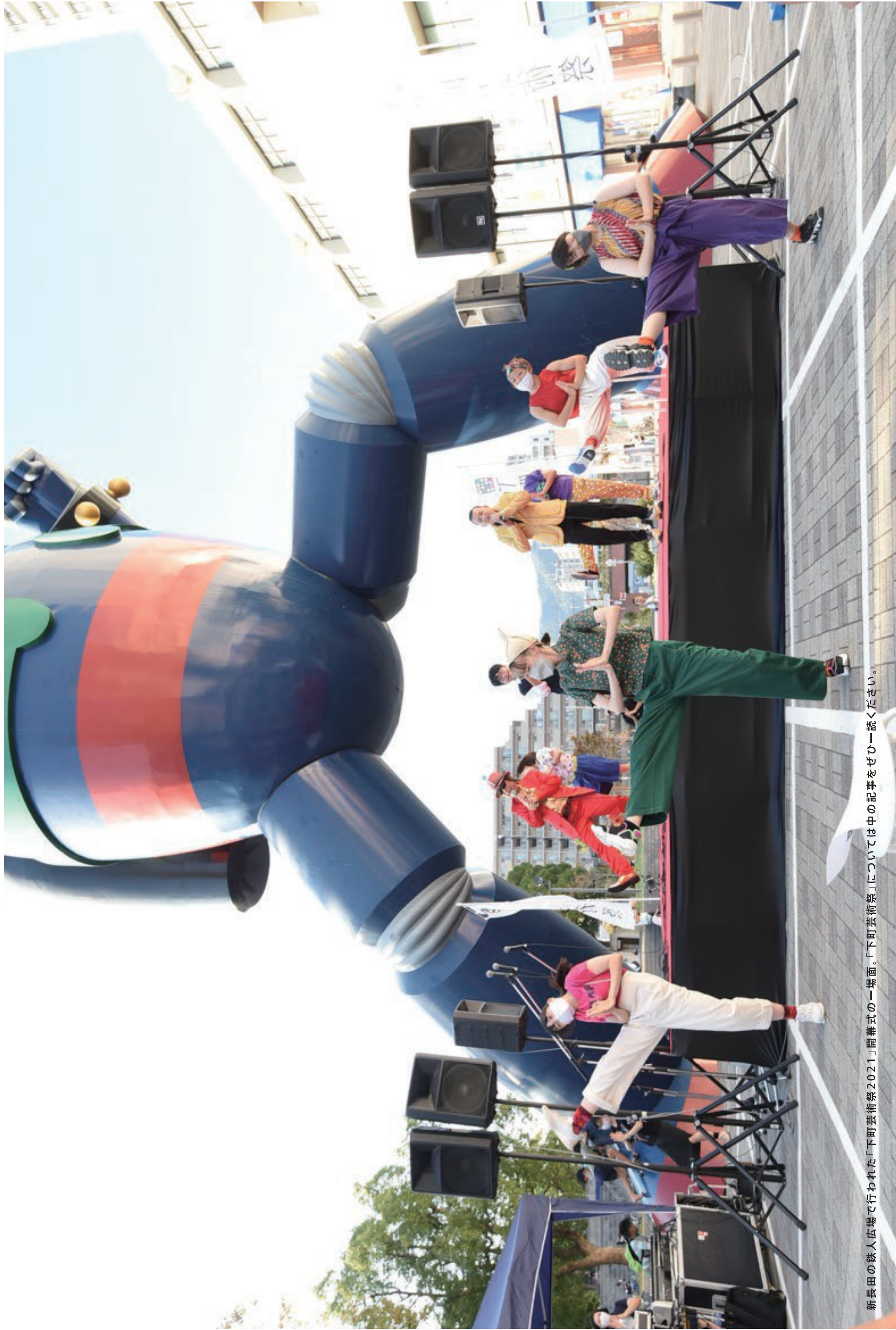
新長田の鉄人広場で行われた「下町芸術祭2021」開幕式の一場面。「下町芸術祭」については中の記事をぜひ一読ください。