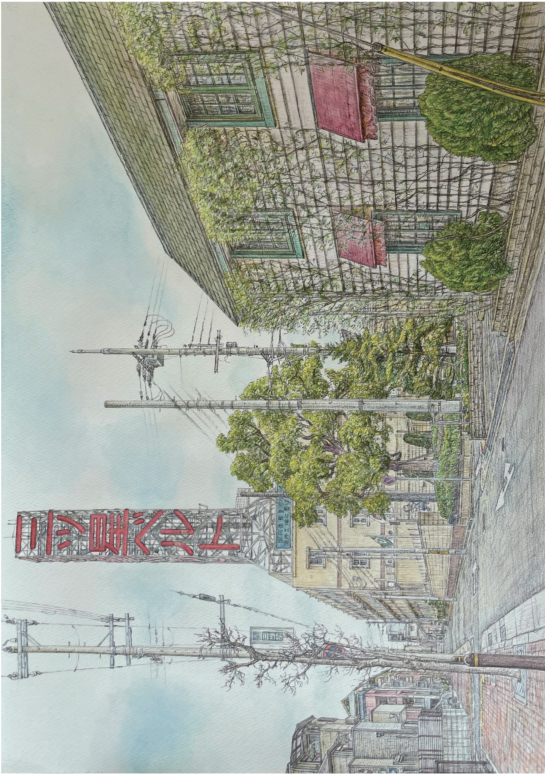
「三ツ星ペルト広告塔」(神戸市長田区浜添通4丁目・2020年2月)